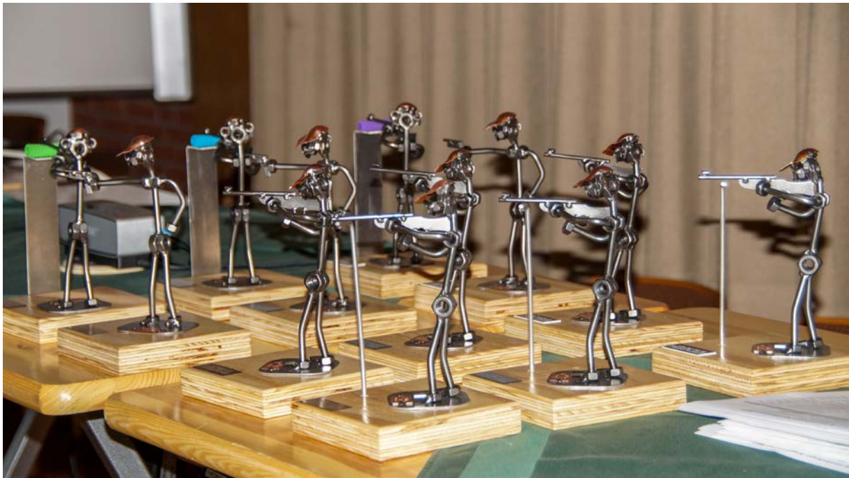
Die Mannschaftsauszeichnungen hoch konzentriert beim Zielvorgang 2017