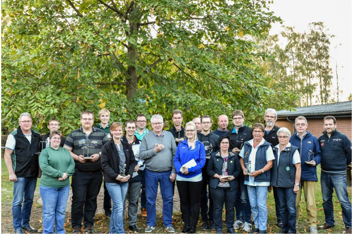
Strahlende Gesichter im Anschluss an die Siegerehrung 2018