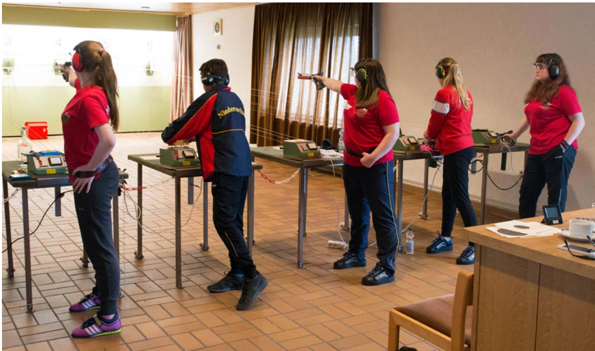
...und natürlich auch vor den Scheiben in der Praxis 2016