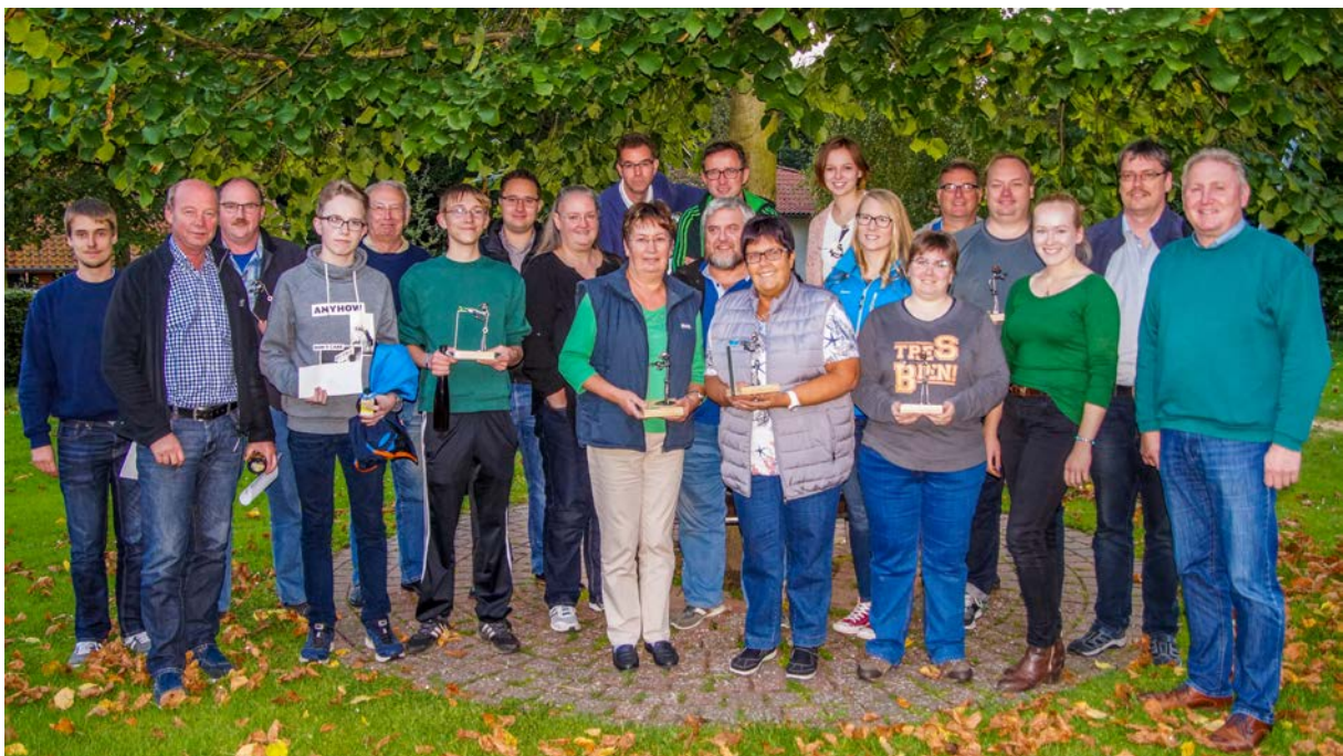
Konditionsstarke Sieger und Platzierte 2017