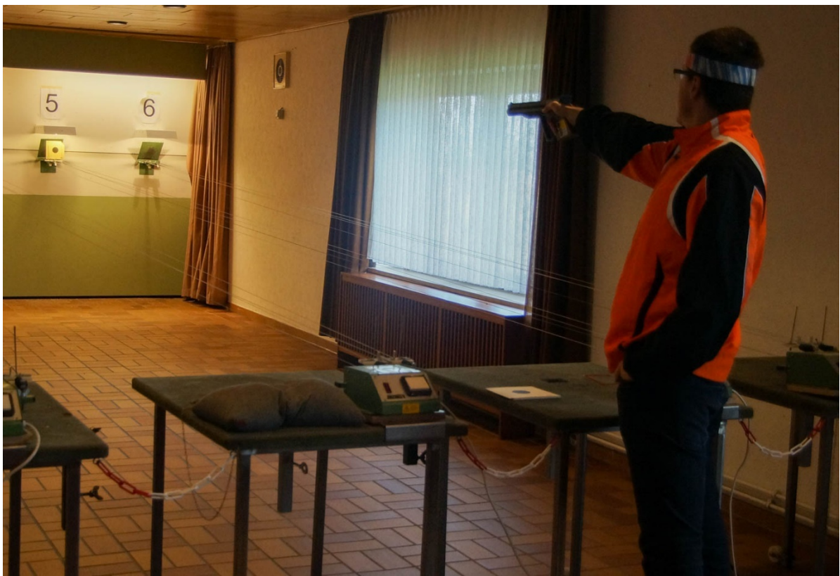
Ein zielsicherer LP-Schütze beim Wettkampf 2015