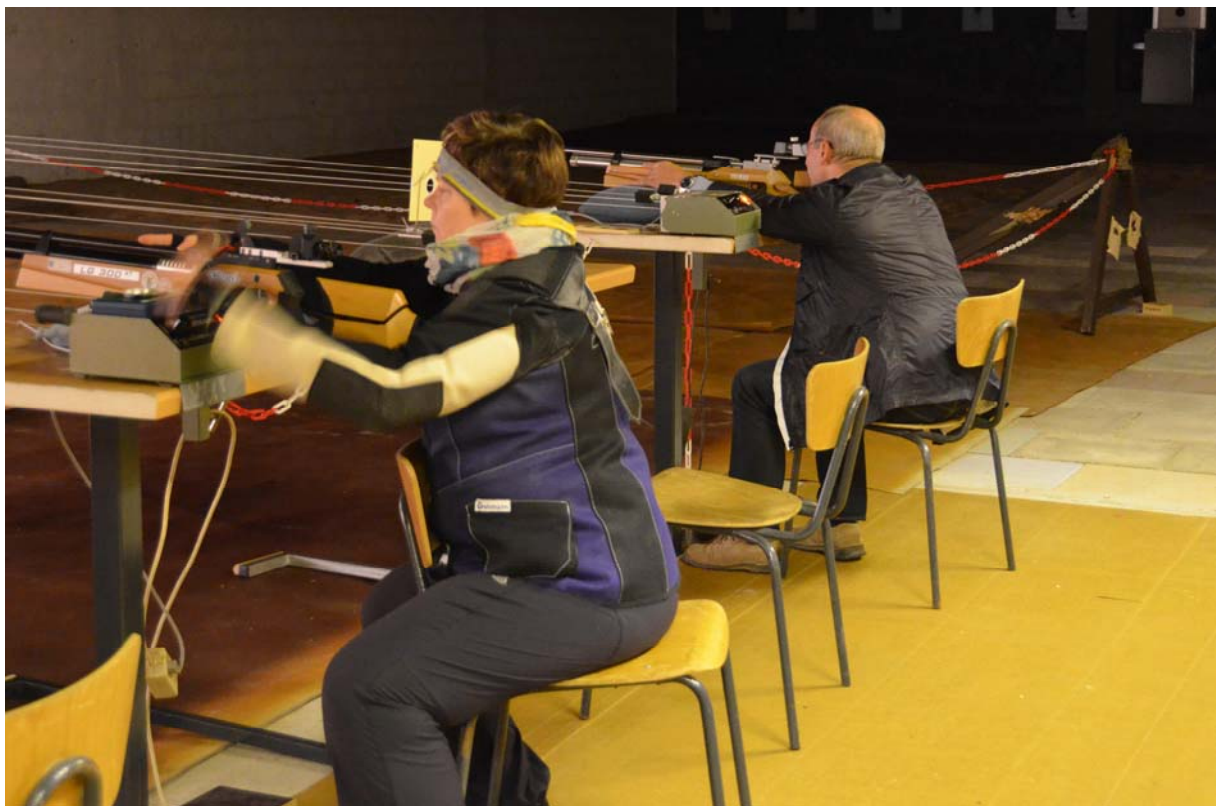
„Sandsack“-Schützen konzentriert bei der Sache 2013