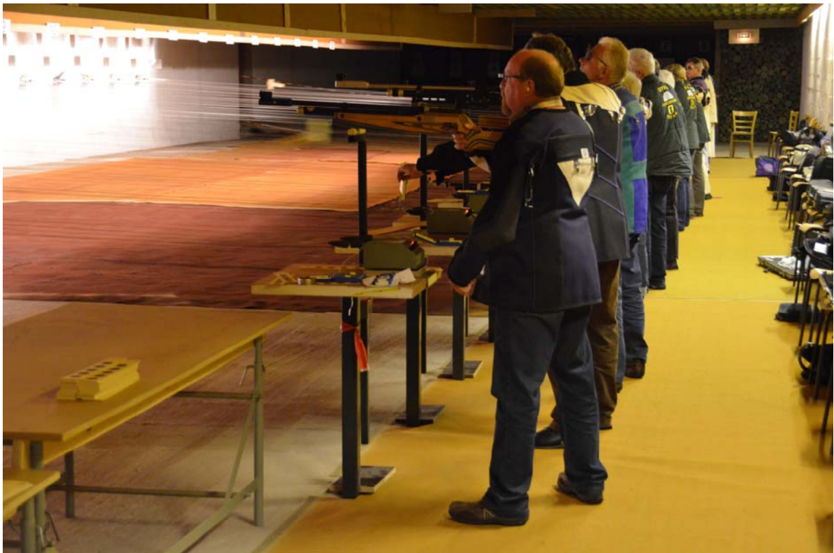
Aufgelegtschützen 2011 während ihres Wettkampfes