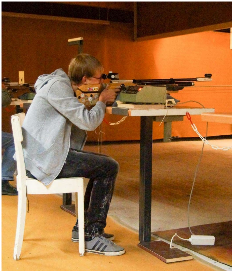
Den Standrekord erfolgreich im Visier – 1069,0 Ring !! 2015