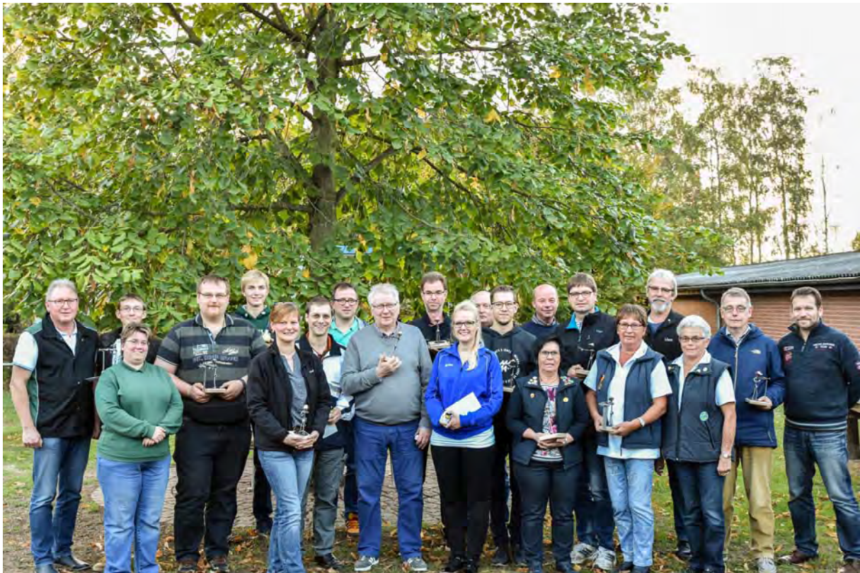
Strahlende Gesichter im Anschluss an die Siegerehrung 2018