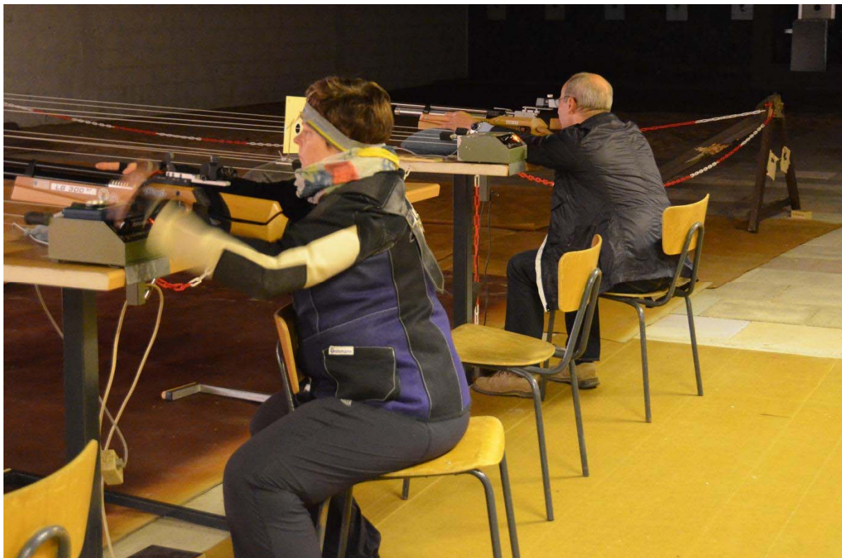
„Sandsack“-Schützen konzentriert bei der Sache 2013