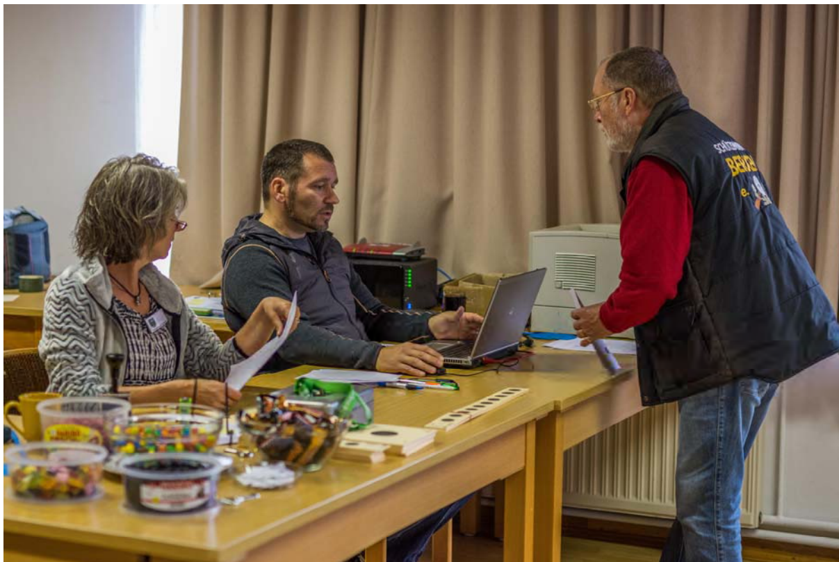
Ein eingespieltes Team auf beiden Seiten des Tisches an der Anmeldung 2019