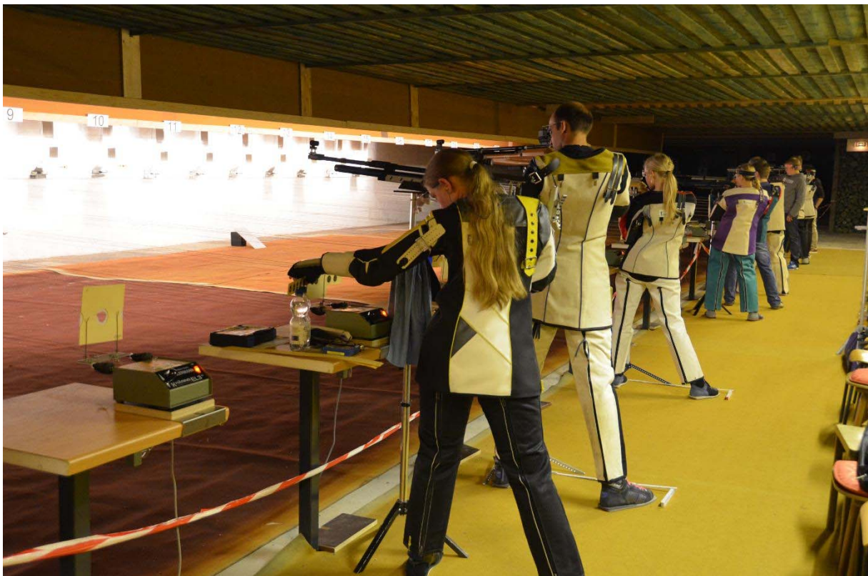
konditionsstarke Luftgewehrschützen im Jahr 2012