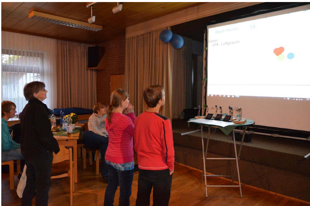
Mitfiebern bei der Auswertung 2012