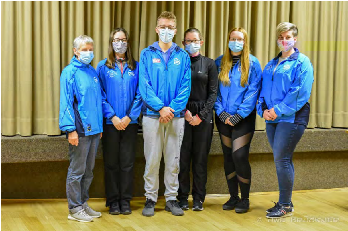
„Strahlende“ Konditionsstarke und neue Rekordhalter LG-Einzel und Mannschaft 2020