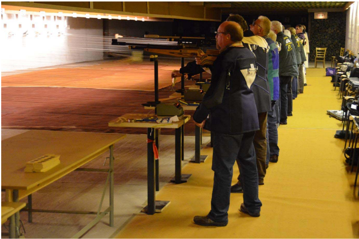
Auflageschützen 2011 während ihres Wettkampfes