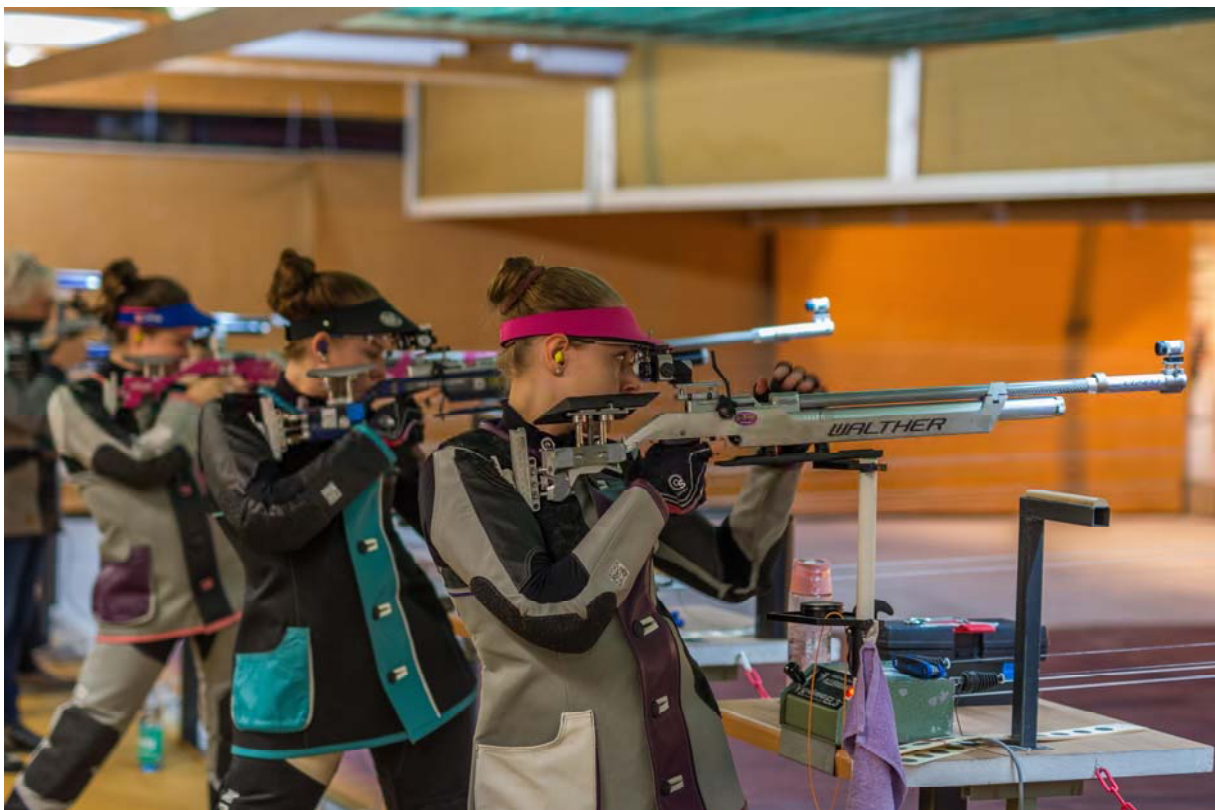
Junge Schützinnen setzen ein Ausrufezeichen 2019