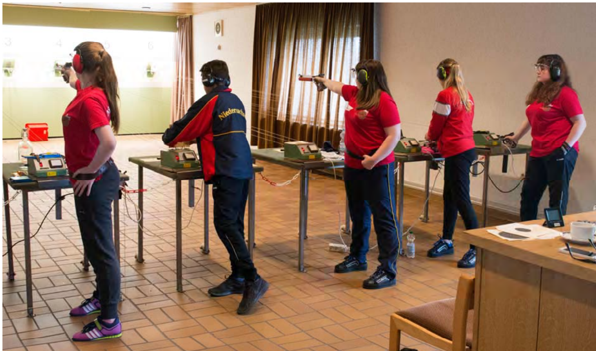
...und natürlich auch vor den Scheiben in der Praxis 2016