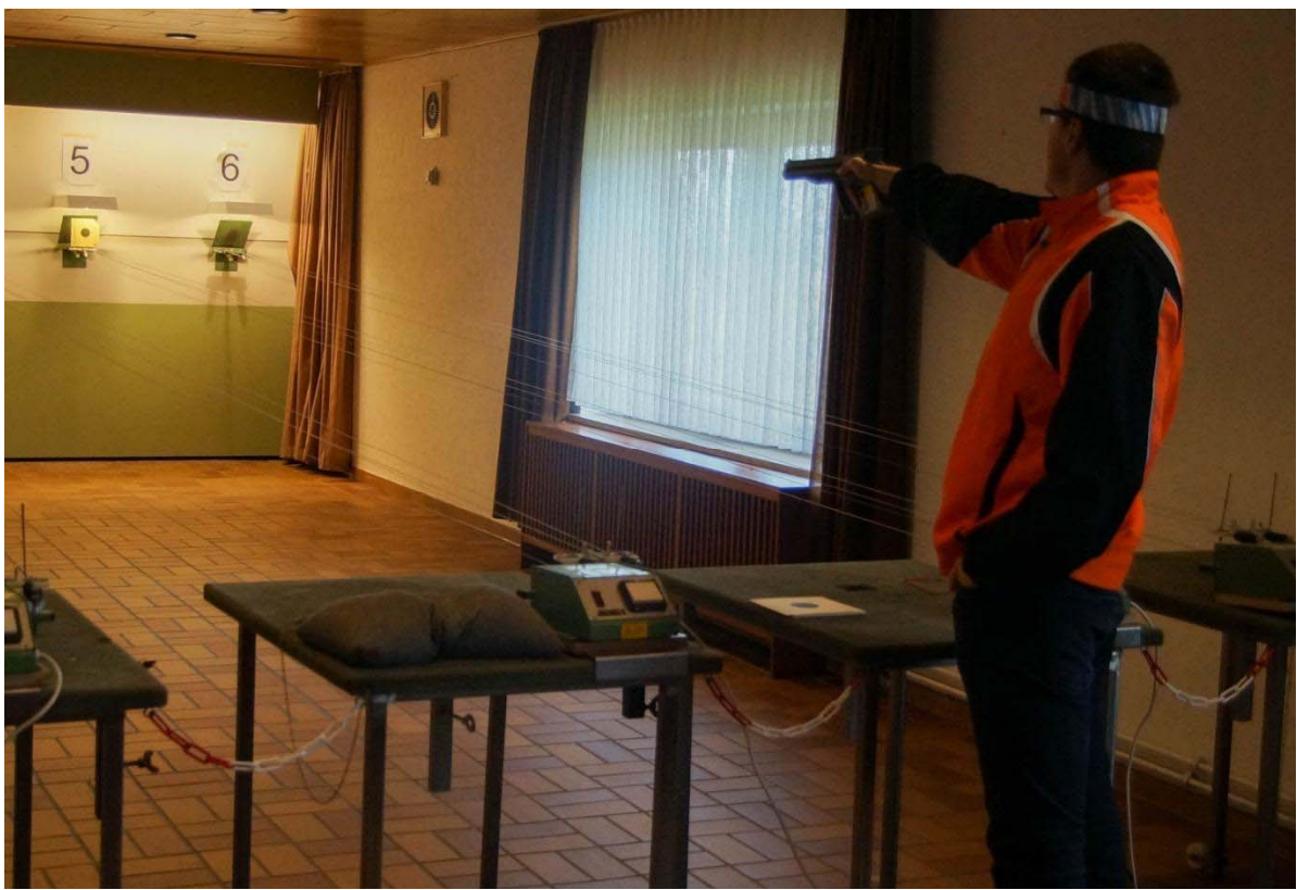
Ein zielsicherer LP-Schütze beim Wettkampf 2015