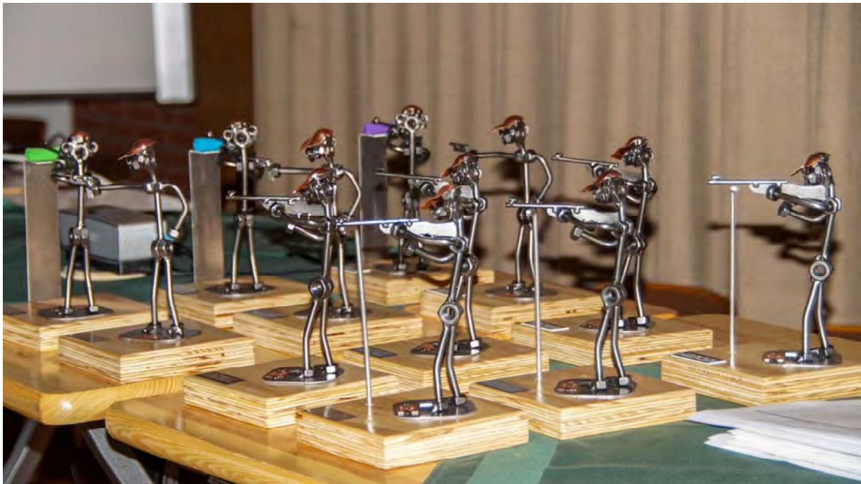
Die Mannschaftsauszeichnungen hoch konzentriert beim Zielvorgang 2017